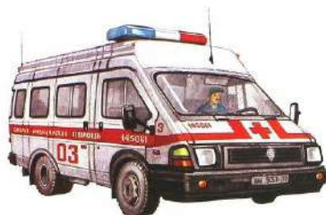
машина «Скорая помощь»