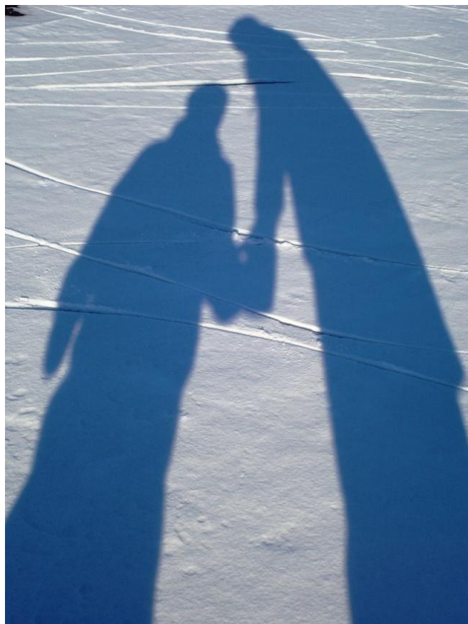
Тень на снегу.